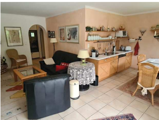
Wohnraum + Küche