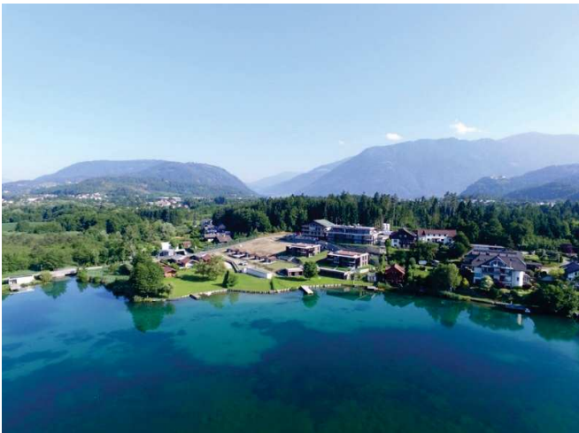
Lage am See